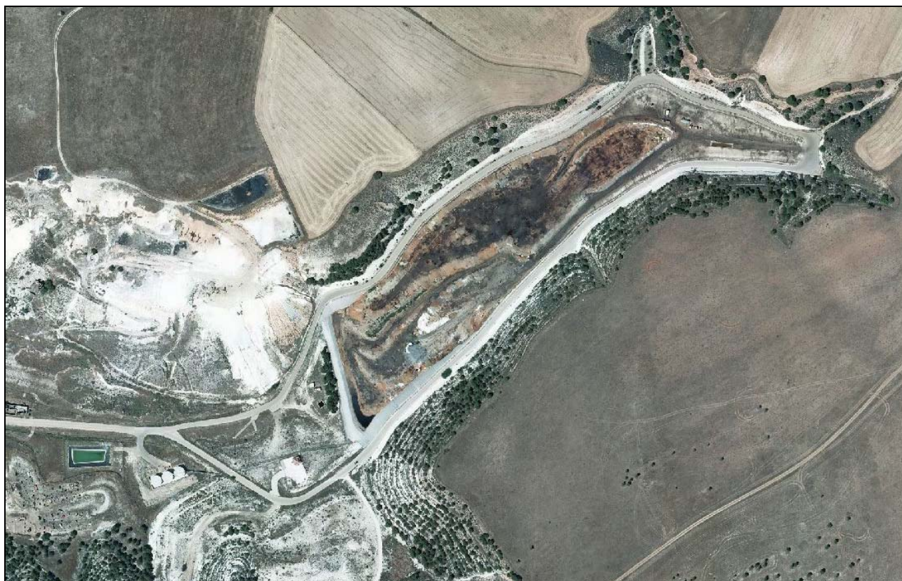
Imagen aérea del depósito de seguridad de Residuos Industriales de Santovenia de Pisuerga (Valladolid)

El presente informe se realiza a petición de la asociación Ecologistas en Acción de Valladolid y tiene como principal objetivo identificar el régimen urbanístico aplicable en la actualidad a los terrenos donde se ubica el depósito de seguridad de residuos industriales de la empresa CETRANSA en el municipio de Santovenia de Pisuerga (Valladolid), tras la anulación por el Tribunal Constitucional de la disposición adicional de la Ley 9/2002, de 10 de julio, para la declaración de proyectos regionales de infraestructuras de residuos de singular interés para la Comunidad, por Sentencia de 4 de junio de 2013 (Boletín Oficial del Estado de 2 de julio de 2013). La disposición adicional de la Ley 9/2002 declaraba como Proyecto Regional la instalación que nos ocupa, y en su punto 3 clasificaba como “Suelo Rústico con Protección de Infraestructuras” los terrenos afectados por dicho depósito de seguridad, conforme a la documentación referida en el anexo. Para identificar el régimen urbanístico aplicable en estos momentos, una vez anulada dicha disposición adicional, es necesario acudir al planeamiento urbanístico general y a los instrumentos de ordenación del territorio vigentes para este espacio del municipio de Santovenia de Pisuerga.