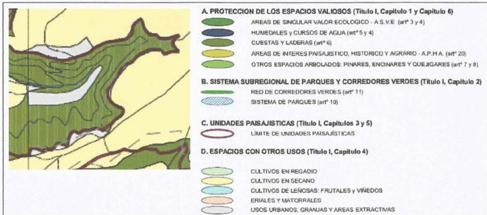
Detalle del Plano de Ordenación 1: Protección de Espacios Valiosos de las DOTVAENT

Según se aprecia en el “Plano de Ordenación 1: Protección de Espacios Valiosos” de las DOTVAENT, los terrenos ocupados en la actualidad por el depósito de seguridad de residuos industriales de Santovenia de Pisuerga están delimitados como “Cuestas y Laderas”, en coherencia con la definición que da de éstas el artículo 6.1 de las DOTVAENT (“se entiende por cuestas y laderas tanto el espacio plano en la cornisa del páramo como el sector inferior con mayores pendientes y los espacios arbolados de su ámbito”) y con la apreciación de su disposición adicional tercera sobre los límites de dichos Planos de Ordenación, constituidos en el caso de las cuestas y laderas que nos ocupan por la cornisa del páramo.