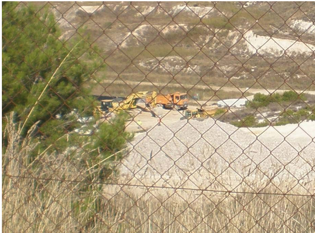
Maquinaria pesada realizando movimiento de tierras