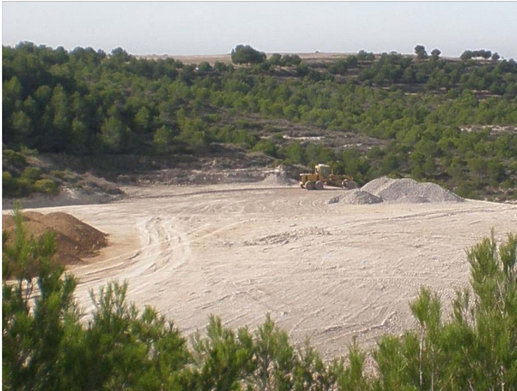
Detalle de una retroexcavadora realizando movimiento de tierras